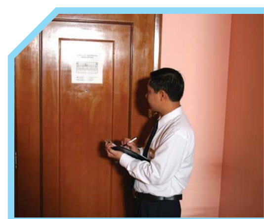
KIỂM TRA NỘI QUY PHÒNG CHÁY TRONG PHÒNG KHÁCH 10