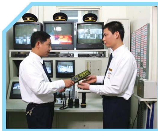
BÀN GIAO CHÌA KHÓA