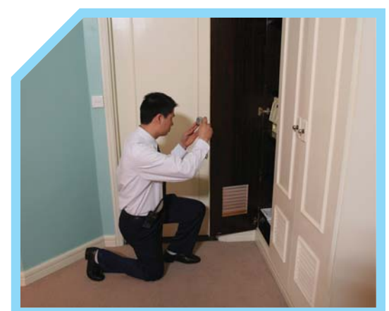
BẢO QUẢN BẰNG CHỨNG BẰNG CÁCH CHỤP ẢNH BẰNG CHỨNG