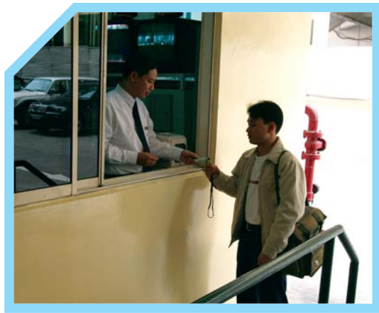
KIỂM TRA LÝ DO KHÁCH VÀO KHÁCH SẠN