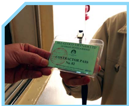
CẤP THẺ KHÁCH THĂM CHO KHÁCH