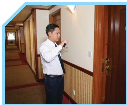
THÔNG BÁO CHO BỘ PHẬN LỄ TÂN