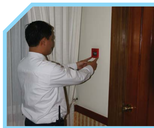
HƯỚNG DẪN THÔNG BÁO CHÁY 7