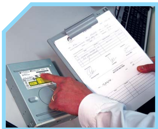
GHI LẠI CÁC THIẾT BỊ MANG RA KHỎI KHÁCH SẠN