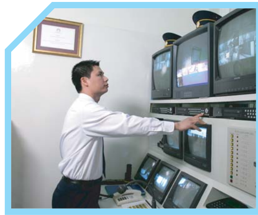
12 BIẾT CÁC HOẠT ĐỘNG ĐANG DIỄN RA TRONG KHÁCH SẠN