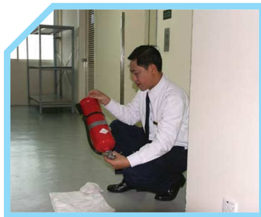
KIỂM TRA TRỌNG LƯỢNG