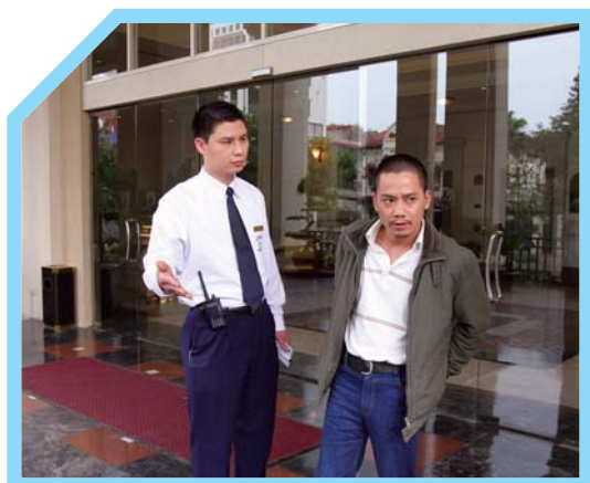
CHO THẤY THÁI ĐỘ CHUYÊN NGHIỆP