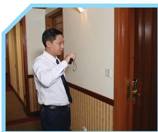
BÁO CÁO VỀ TÌNH TRẠNG CỬA PHÒNG KHÁCH ĐỂ NGỒ