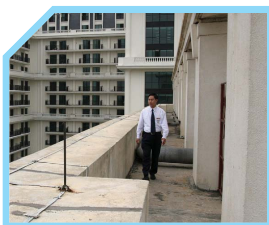
KIỂM TRA MÁI NHÀ