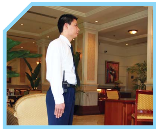
TÓC NGẮN VÀ CHẢI GỌN GÀNG