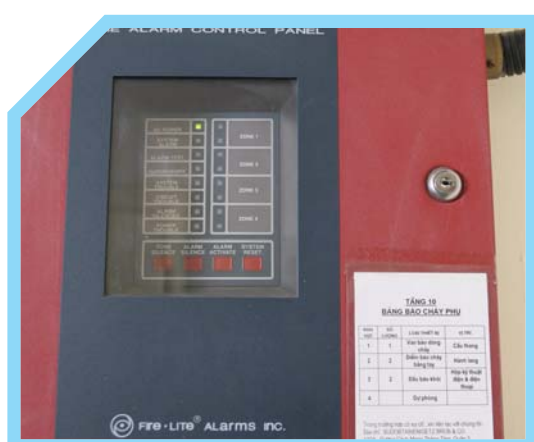
BẢNG KIỂM SOÁT HỎA HOẠN 8