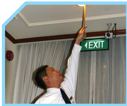
KIỂM TRA ĐÈN BÁO KHẨN CẤP