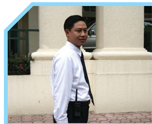
HIỂU RÕ LUẬT PHÁP SỞ TẠI 10