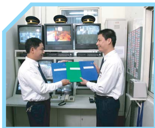
SỔ GHI CHÉP TÌNH HÌNH PHẢI ĐƯỢC CẬP NHẬT VÀ BÀN GIAO TẠI MỌI CA LÀM VIỆC