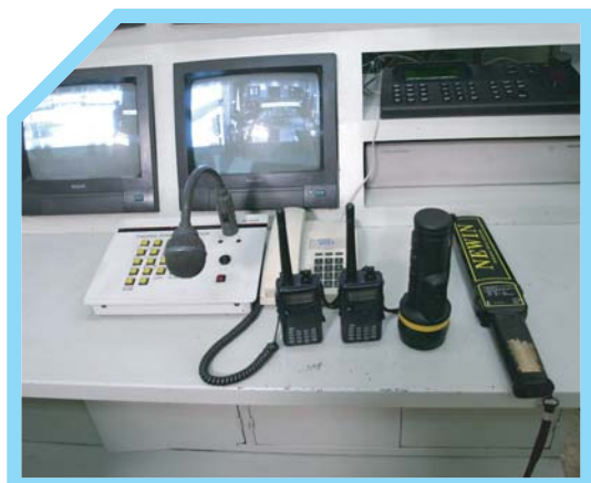
13 BIẾT CÁC HOẠT ĐỘNG ĐANG DIỄN RA TRONG KHÁCH SẠN