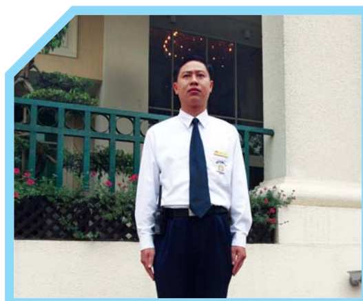
ĐỒNG PHỤC PHẢI SẠCH SẼ