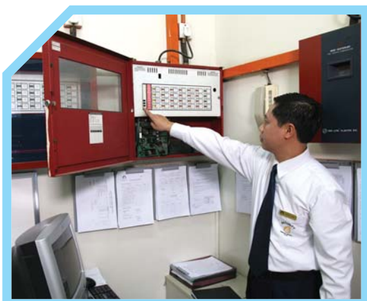
BIẾT CÁC DỊCH VỤ KHẨN CẤP TRONG KHU VỰC 3