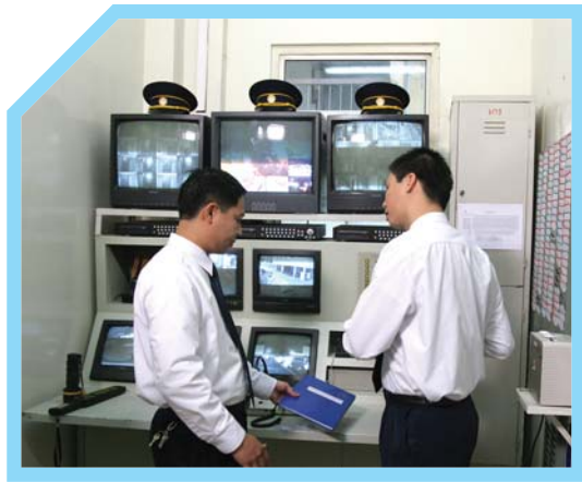
11 BÁO CÁO TÓM TẮT TÌNH HÌNH CA LÀM VIỆC