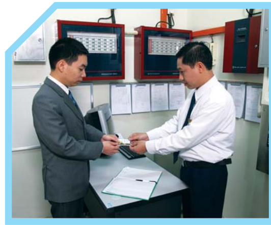
2 HOÀN THÀNH PHIẾU ĐĂNG KÝ CHÌA KHÓA