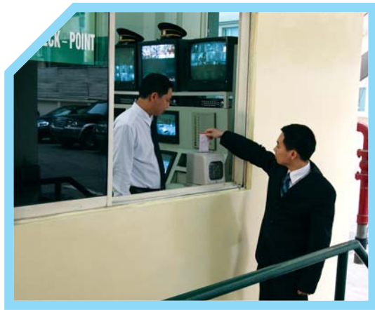
KIỂM TRA CÁC THIẾT BỊ MANG VÀO KHÁCH SẠN