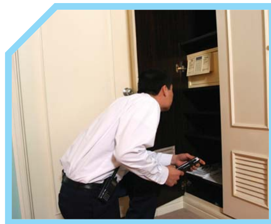
KIỂM TRA NHỮNG ĐỒ VẬT BỊ HỎNG