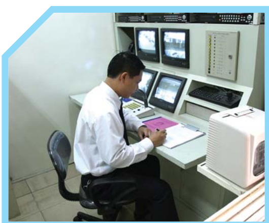
GHI CHÉP TÌNH HÌNH VÀO SỔ TRỰC TUẦN TRA