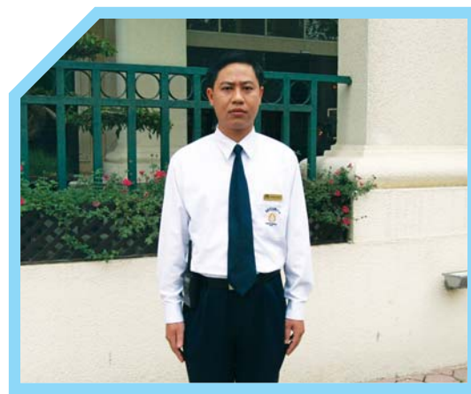
MẶC ĐỒNG PHỤC THEO QUY ĐỊNH CỦA CÔNG TY