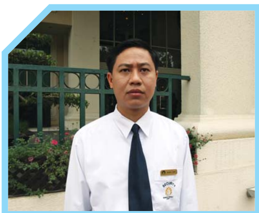
BIỂN TÊN THƯỜNG ĐƯỢC ĐEO TRÊN VE ÁO BÊN TRÁI