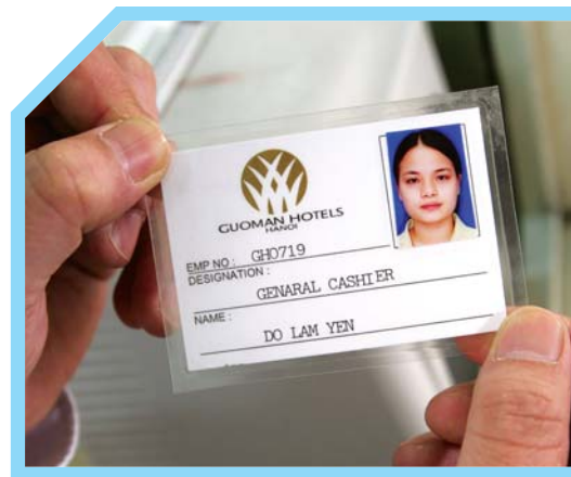
2 THẺ NHẬN DẠNG CỦA KHÁCH SẠN LÀ DÙNG CHỖ CÁ NHÂN VÀ KHÔNG ĐƯỢC CHUYỂN ĐỔI CHO NGƯỜI KHÁC