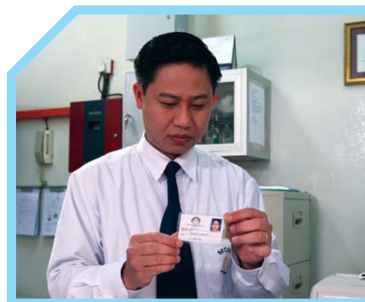
4 KIỂM TRA THẺ GIÚP BẢO ĐẢM AN NINH VÀ AN TOÀN CHO KHÁCH SẠN