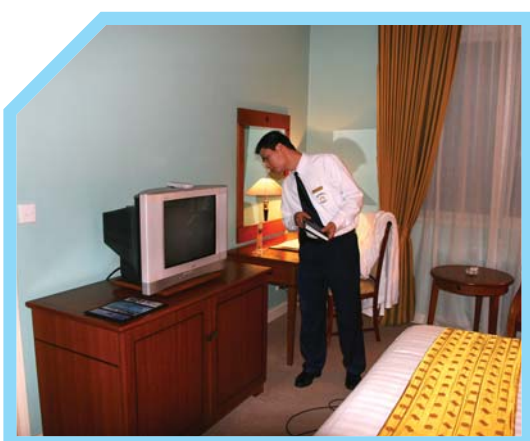
KIỂM TRA KHÔNG GIAN BUỒNG KHÁCH