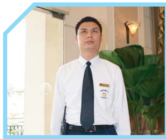
CẠO RÂU SẠCH SẼ