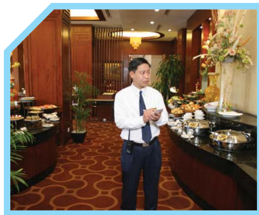
KIỂM TRA CÁC KHU VỰC CÔNG CỘNG CỦA KHÁCH SẠN