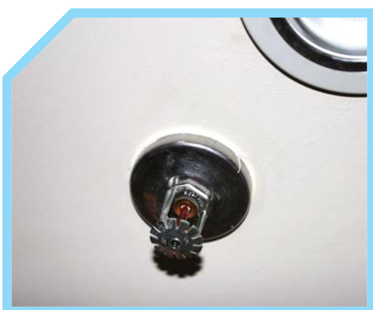
HỆ THỐNG VÒI PHUN NƯỚC