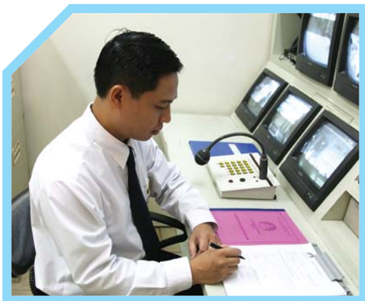
HOÀN THÀNH GHI CHÉP SỔ THEO DÕI VÀ SỔ TIN NHẮN