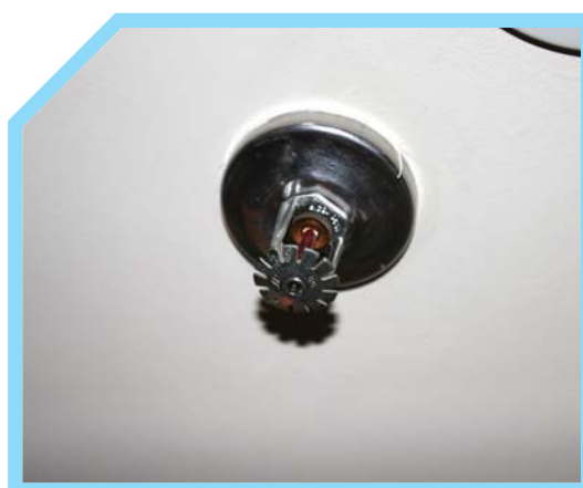
ĐƯỢC LẮP ĐẶT TRONG KHU VỰC PHÒNG CỦA KHÁCH VÀ HÀNH LANG KHÁCH SẠN