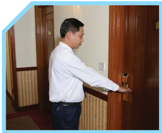
GÕ CỬA HAI LẦN TRƯỚC KHI VÀO PHÒNG KHÁCH