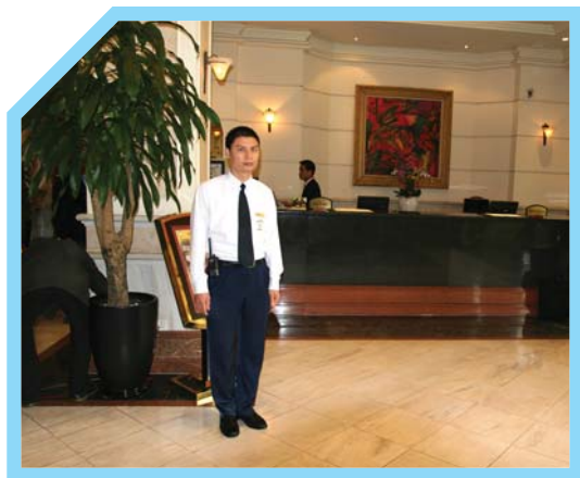
KIỂM TRA CÁC KHU VỰC TRONG KHÁCH SẠN