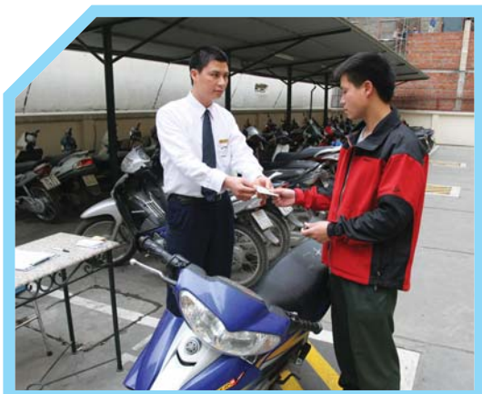
NHẬN LẠI VÉ TRÔNG XE