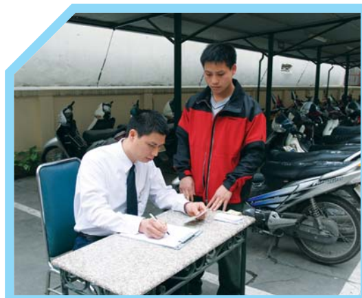
GHI LẠI NHỮNG DẤU HIỆU BẤT THƯỜNG