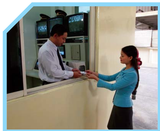
3 KIỂM TRA THẺ NHẬN DẠNG CỦA NHÂN VIÊN