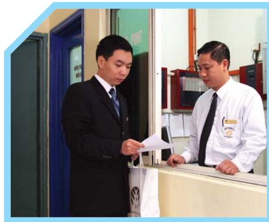
KIỂM TRA KỸ CÀNG TÌNH TRẠNG THIẾT BỊ NHƯ SỐ LƯỢNG, MÔ TẢ KỸ THUẬT V.V...