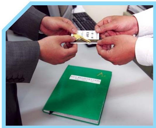
3 NHẬN CHÌA KHÓA VÀ HOÀN THÀNH PHIẾU ĐĂNG KÝ CHÌA KHÓA