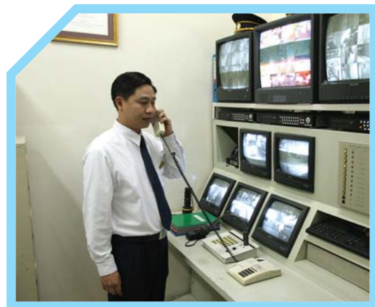
BIẾT CHỨC NĂNG CỦA ĐIỆN THOẠI VÀ CÁCH CHUYỂN CUỘC GỌI