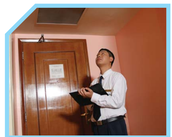
KIỂM TRA THIẾT BỊ PHÁT HIỆN NHIỆT