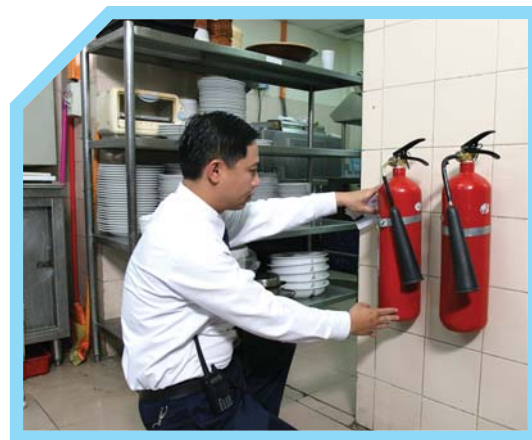
BÌNH CHỮA CHÁY DÙNG BỘT KHÍ CO 2