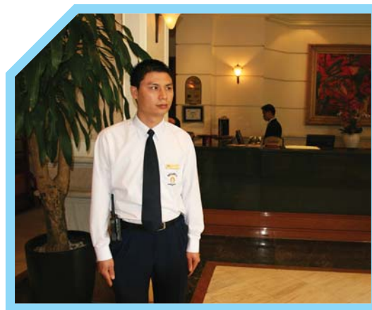
HIỂU BIẾT VỀ KHÁCH SẠN VÀ CÁC KHU VỰC DỊCH VỤ CỦA KHÁCH SẠN 2