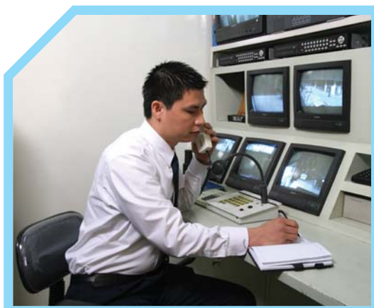
BIẾT CÁC DỊCH VỤ KHẨN CẤP TRONG KHU VỰC 9