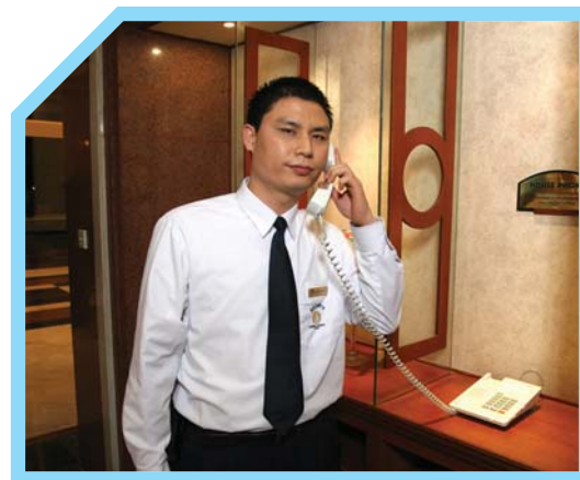
BIẾT QUY ĐỊNH CỦA CÔNG TY VỀ CÁCH TRẢ LỜI ĐIỆN THOẠI VÀ CHÀO KHÁCH