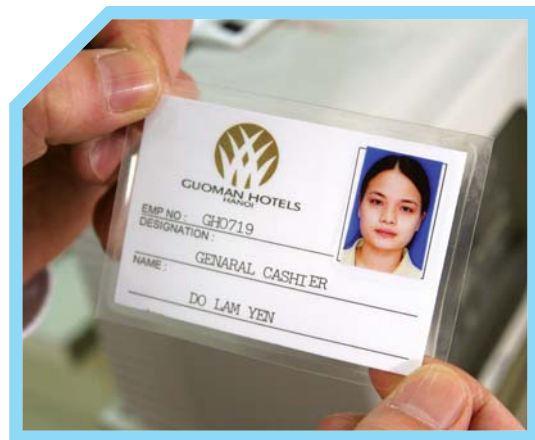
1 THẺ NHẬN DẠNG CỦA KHÁCH SẠN HAY CÒN GỌI LÀ THẺ NHÂN VIÊN KHÁCH SẠN