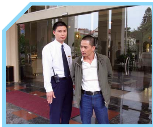
YÊU CẦU NGƯỜI ĐÓ RỜI ĐI