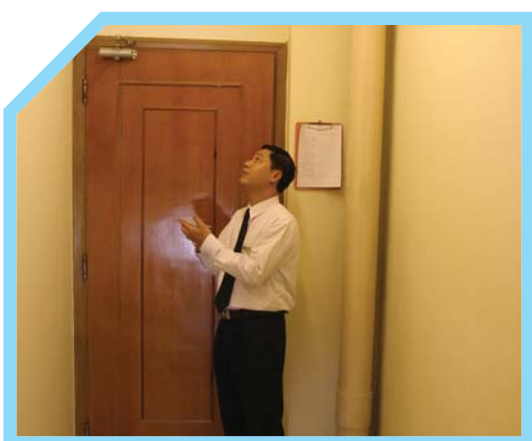
KIỂM TRA KHU VỰC DÀNH CHO NHÂN VIÊN