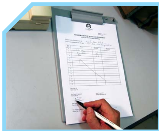
GHI LẠI VIỆC CẤP THẺ VÀO HỒ SỔ THẺ CHO KHÁCH