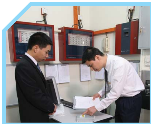
GHI LẠI TÊN ĐẦY ĐỦ CỦA NGƯỜI NHẬN VÀ TÊN CỦA BẠN