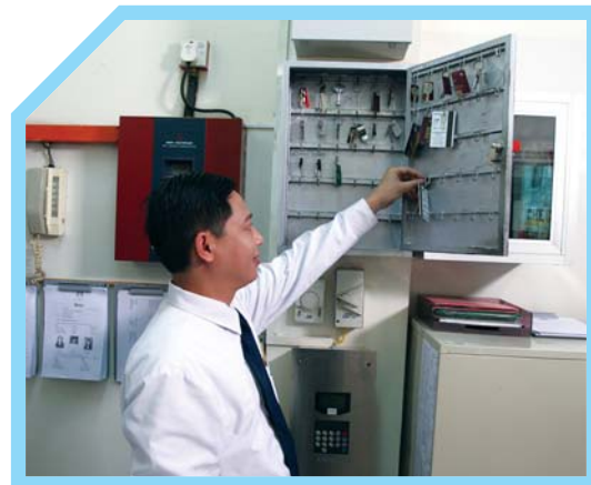
4 CẮT GIỮ CHÌA KHÓA