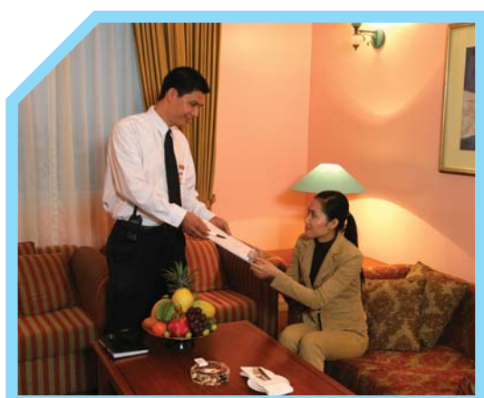
HOÀN THÀNH LỜI KHAI CỦA NẠN NHÂN 8