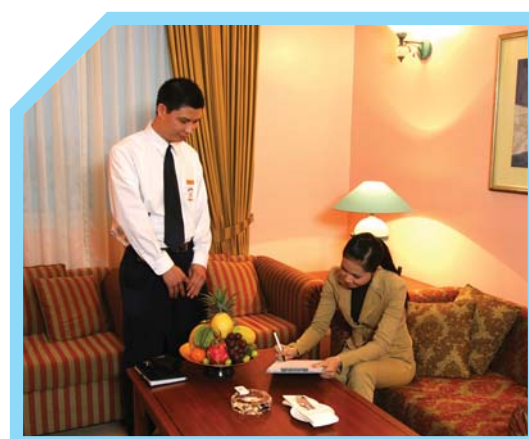
TUÂN THỦ CHÍNH SÁCH CỦA KHÁCH SẠN KHI THÔNG BÁO CHO NẠN NHÂN VỀ TRÁCH NHIỆM CỦA KHÁCH SẠN 9