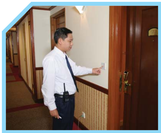
KIỂM TRA CÁC TẦNG KHÁCH