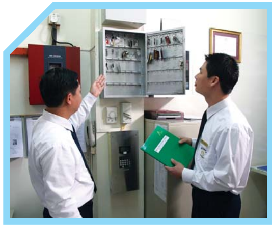
1 BIẾT RÕ VỀ NGƯỜI MÀ BẠN CÓ THỂ BÀN GIAO CHÌA KHÓA