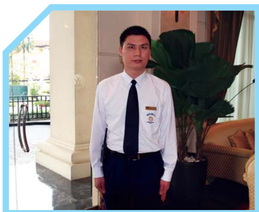
RỬA TAY SẠCH SẼ