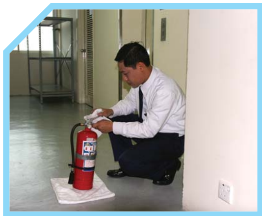
KIỂM TRA DẤU NIÊM PHONG