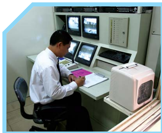
GHI CHÉP LẠI CÁC SỰ VIỆC