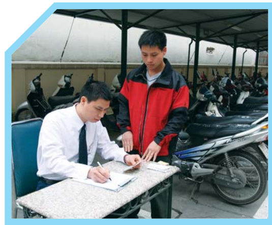
BIẾT RÕ NHÂN VIÊN ĐƯỢC PHÉP ĐỂ XE TRONG KHU VỰC NHÀ XE CỦA KHÁCH SẠN