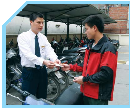
CẤP VÉ TRÔNG XE