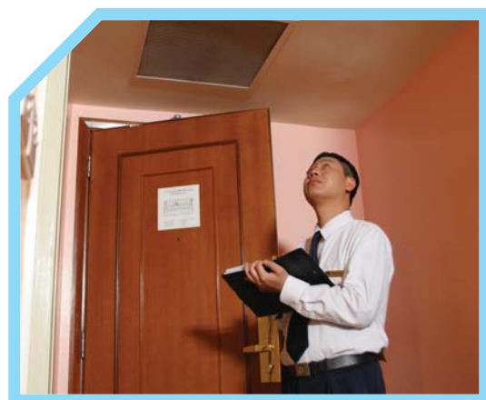
KIỂM TRA THIẾT BỊ PHÁT HIỆN KHÓI 6