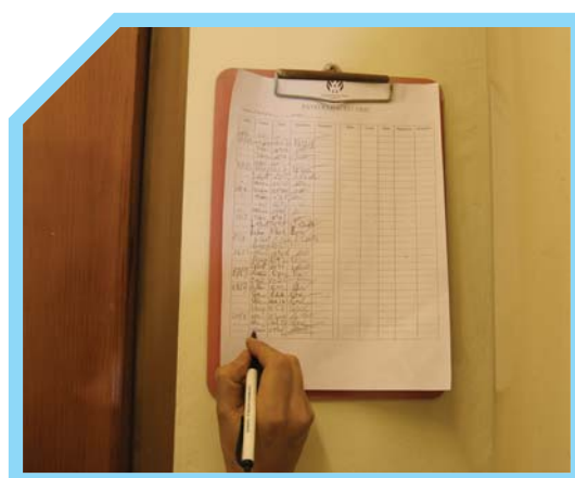
THEO QUY TRÌNH GHI CHÉP SỔ TRONG CA LÀM VIỆC