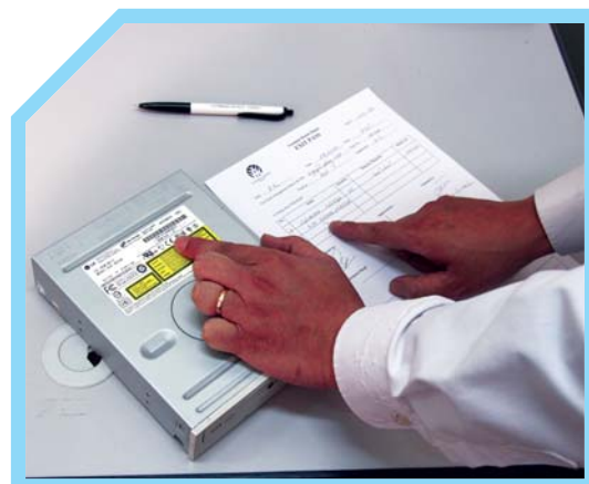
GHI LẠI VIỆC TIẾP NHẬN CÁC THIẾT BỊ MANG VÀO