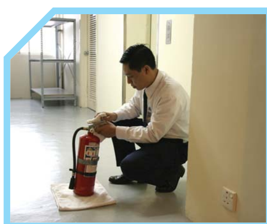
KIỂM TRA BÌNH CHỮA CHÁY 9