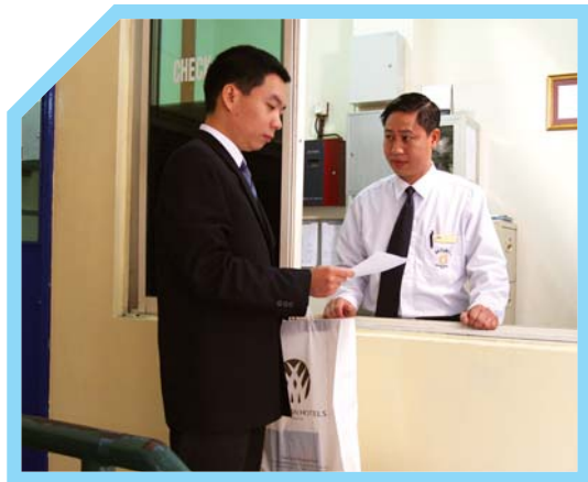
GIẤY PHÉP PHẢI CÓ CHỮ KÝ CỦA NGƯỜI CÓ THẨM QUYỀN