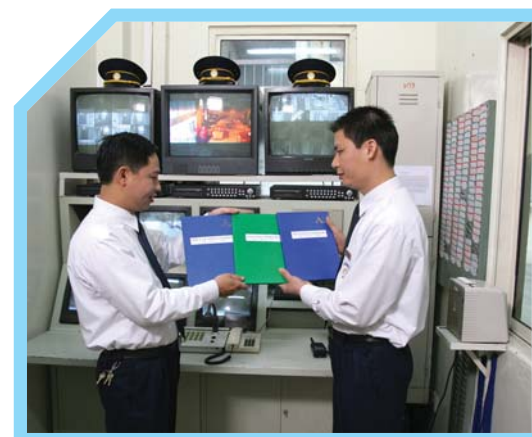
SỔ GHI LỜI NHẮN PHẢI ĐƯỢC CẬP NHẬT VÀ BÀN GIAO TẠI MỌI CA LÀM VIỆC