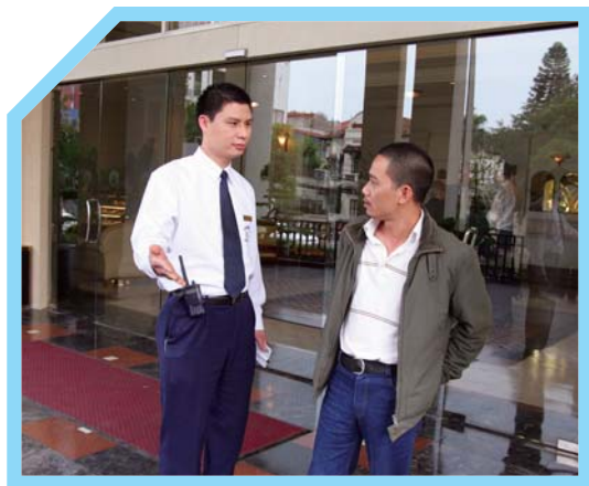
CHÀO KHÁCH VÀ GIỚI THIỆU BẢN THÂN BẠN VỚI KHÁCH