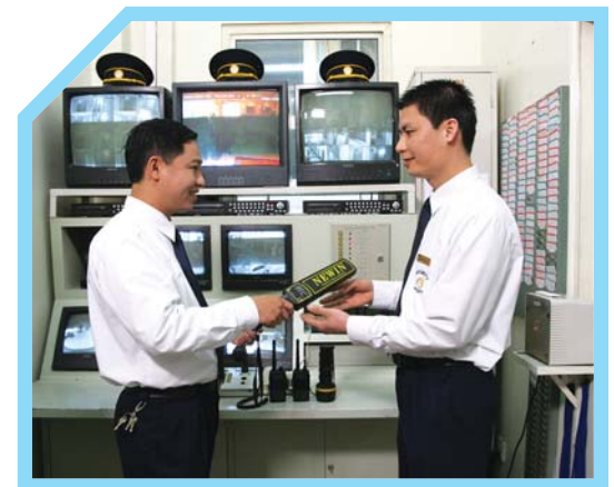
RÀ SOÁT XEM DANH MỤC KIỂM TRA ĐÃ HOÀN TẤT CHƯA