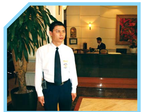
TẮM RỬA SẠCH SẼ TRƯỚC KHI LÀM VIỆC