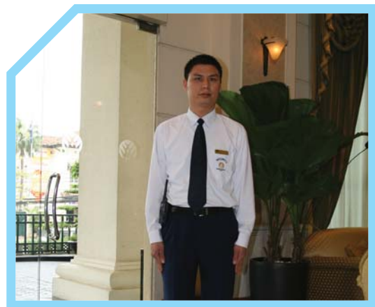
BIẾT RÕ ĐỊA CHỈ CỦA KHÁCH SẠN 1