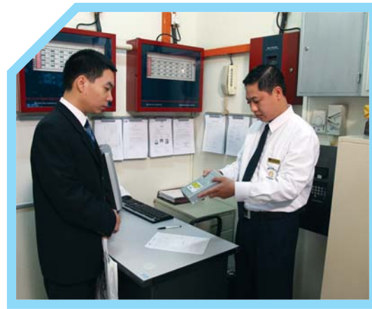
KIỂM TRA KỸ CÀNG TÌNH TRẠNG CÁC THIẾT BỊ