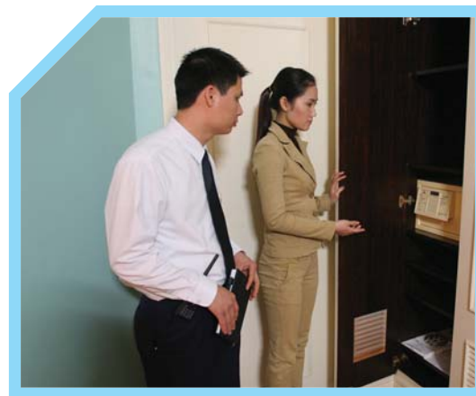
LẮNG NGHE MỘT CÁCH CẨN THẬN 7