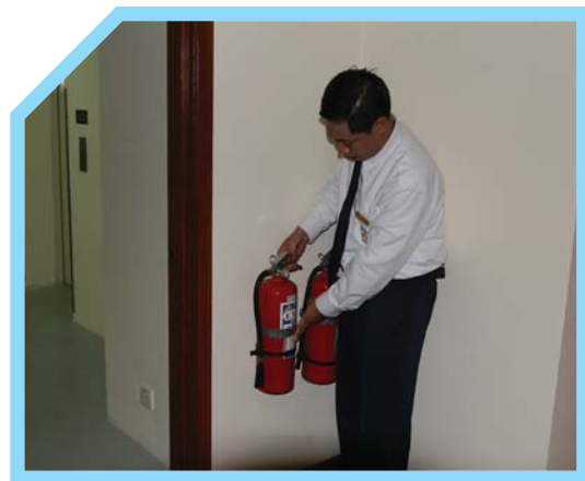
CÁC LOẠI BÌNH CHỮA CHÁY KHÁC NHAU