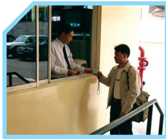
LÀM THẺ KHÁCH THĂM