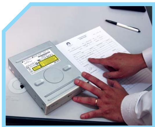
KIỂM TRA SỐ LƯỢNG VÀ TÌNH TRẠNG CỦA THIẾT BỊ