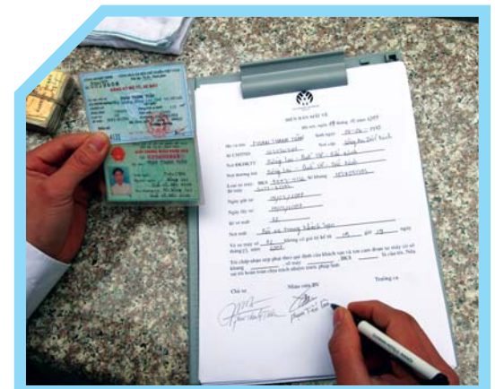
GHI VÀO SỔ THEO DÕI TÌNH HÌNH TRONG CA LÀM VIỆC