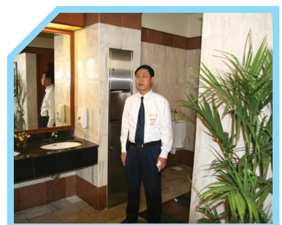
KIỂM TRA PHÒNG VỆ SINH DÀNH CHO KHÁCH