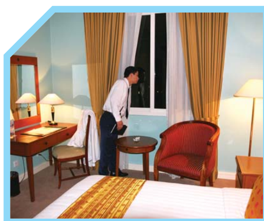
KHÔNG SỜ VÀO HOẶC DỊCH CHUYỂN BẤT KỲ BẰNG CHỨNG NÀO