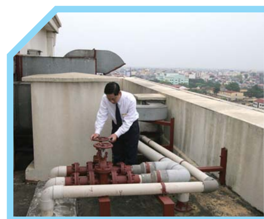
KIỂM TRA KHU VỰC ĐỂ NỔI HƠI CỦA KHÁCH SẠN