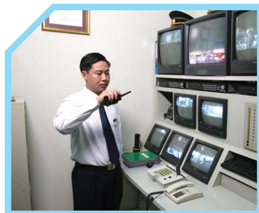
14 TRẢ LỜI BỘ ĐÀM